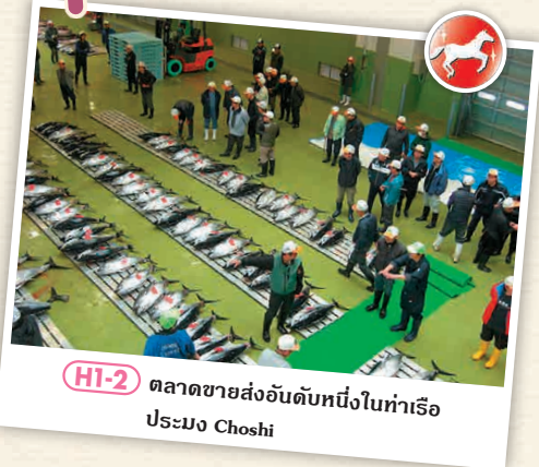
HI-2 ตลาดขายส่งอันดับหนึ่งในท่าเรือประมง Choshi

ร้านอาหารที่บริหารจัดการโดยตรงจากท่าเรือประมงโชชิ นอกจากเรื่องปลาพรีเมียมและรสชาติแล้ว ยังสามารถทานปลาที่ยากได้ในราคาถูกอีกด้วย 📍 186 อิบูมะ-โช, โทชิ-ชิ | 📞 0479-21-6671 🕒 8:00 - 14:00 น. 📍 3 วันอังคาร (ในกรณีที่เป็วันหยุดนักขัตฤกษ์จะหยุดในวันถัดไป) 📍 3