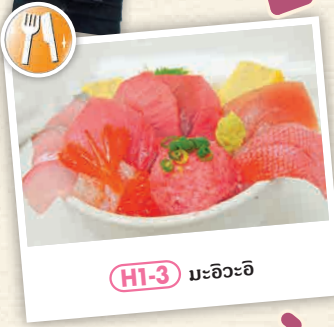
HI-3 มะอิวะอิ

📍 2. โทกะวะ-มาชิ - มิชิบะ-โช 📞 0479-22-0316 🕒 ไม่มีวันหยุด 🕒 ชั่วโมง "โคมะวะริเทเกตะ (Komawaritegata)" 700 เยน 📍 3