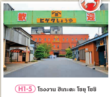
HI-5 โรงงาน อิเกะตะ โชยุ โชชิ

ตามการเล่าขานของชาวบ้าน วัดนี้สร้างขึ้นเพื่อเป็นที่ประดิษฐานของพระโพธิสัตว์กวนอิม 11 เศียรที่ติดมากับอวนหาปลาของชาวประมงในปี 728 ในฐานะพระประธาน 📍 293 อะระอิ-โช, โทชิ-ชิ | 📞 0479-23-1316 📍 สามารถเดินชมได้ทั้งข้างอิสระในขอบเขตพระอาราม (พระอุโบสถตั้งแต่ 9:00 - 17:00 น.) 📍 3 ไม่มีวันหยุด 🕒 ไม่มีค่าเข้าชม 📍 3