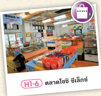
HI-6 ตลาดโชชิ ซึเอ็ล็กซ์