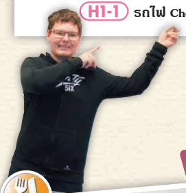
HI-1 รถไฟ Choshi Denki Tetsudo

รถไฟท้องถิ่นที่วิ่งผ่านเขตไรบองฮิสต์ซึบะฮิ สามารถเพลิดเพลินกับทิวทัศน์สองข้างทางที่เป็นเอกลักษณ์ของย่านชนบทในญี่ปุ่นได้ผ่านทางหน้าต่างรถไฟ