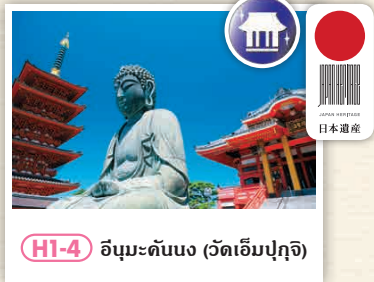
HI-4 อิบูมะดันบง (วัดเอ็มบุคุจิ)

ตลาดที่เชื่อมต่อกับท่าเรือประมงที่โดดเด่นในญี่ปุ่น ซึ่งมีการนำปลาที่จับได้ซึ่งเพิ่งสามารถเข้ามาได้ สามารถดูการแข่งขึ้นการจับปลาที่ศรีครีตริบได้ 📍 1-36-12 อะระอิ-ชิ, โทชิ-ชิ | 📞 0479-22-7626 🕒 8:00 - 11:30 น. 📍 3 วันอาทิตย์และวันหยุดนักขัตฤกษ์ (วันที่ไม่มีปลาขึ้นฝั่งก็สามารถเข้าชมได้) 📍 3