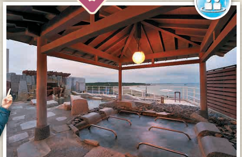
H2-5 อชิโอบินะยุ (อินุโอะชะกิออนเซ็น)

สถานที่พักผ่อนที่มีพร้อมทั้งออนเซ็น ธรรมชาติกลางแจ้งและสระน้ำในตู้อาคาร สบายและเกิดความสุขใจในอาคารเดียวกัน