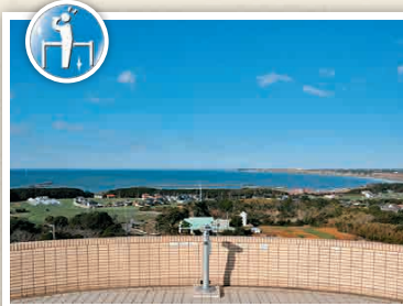
H2-2 หอชมวิวยามเย็นที่มองเห็นโลกเห็นโลกที่มีลักษณะกลมได้