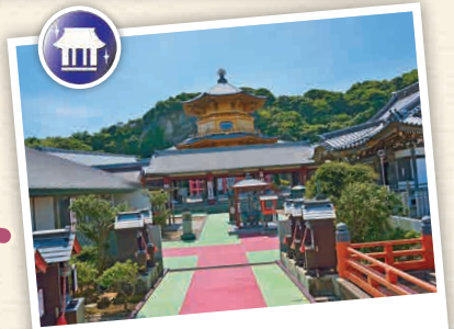
H2-1 อินุโอะชะกิคันงะ วัดมังกังจิ

📞 1421-1 เท็มโปโต, โทชิ-ชิ 📞 0479-25-0930 🕒 9:00 - 17:30 น. (เข้าชมรอบสุดท้ายเวลา 17:00 น. แตกต่างกับขึ้นอยู่กับช่วงเวลา) 🚫 ไม่มีวันหยุด (มีบางกรณีที่มีปิด ขึ้นอยู่กับสภาพอากาศ) 📶 880 เยน 📶