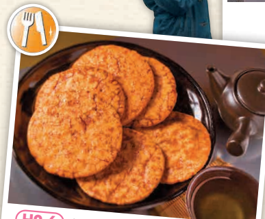
H2-6 ร้านขายสินค้าตรง บุระะเซ็มเบ้ (ในสถานี)

📞 10292-1 อินุโอะชะกิ, โทชิ-ชิ 📞 0479-25-6000 🕒 บ่อน้ำพุร้อน 10:00 - 23:00 น. (วันเสาร์ เปิดถึง 8:00 น. ของวันรุ่งขึ้น), สภาที่นร้อน 10:30 - 22:00 น. (วันเสาร์ - อาทิตย์ และวันหยุดนักขัตฤกษ์ เปิดถึง 23:00 น. ส่วนประจักษ์ขึ้นชื่อ-บ่อน้ำพุร้อนอาซาริน 1 ชั่วโมง) 📶 ไม่มีวันหยุด 📶 1,500 เยน (วันเสาร์-อาทิตย์ วันหยุดนักขัตฤกษ์ และช่วงขึ้นชื่อ 1,700 เยน, ตั้งแต่ 17:00 น. ขึ้นไปจะลดค่าเข้าชม 200 เยน) 📶