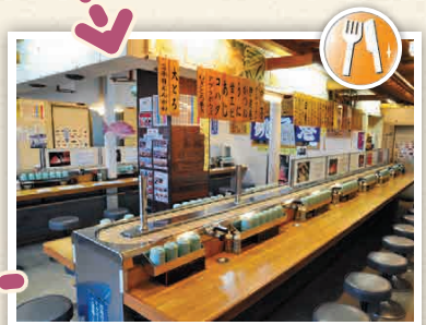
H2-3 สิ้นค้าทะเลชิมะทะกะ

ที่นี่คือร้านอาหารที่เสิร์ฟรายการอาหารประเภทปลาที่จับมาจากท่าเรือประมงท้องถิ่น มีชื่อเสียงโด่งดังเรื่องซูชิที่มีวัตถุดิบที่สด มีซูชิสายพาน พร้อมพร้อมไปด้วยอาหารที่ทำจากปลาท้องถิ่นหลากหลายประเภท