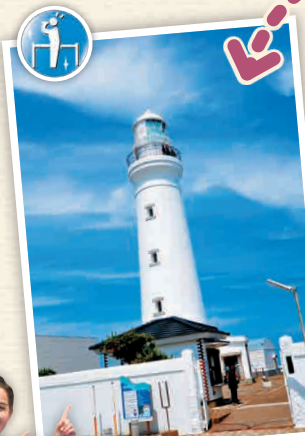
H2-4 ปรากฏการณ์อินุโอะชะกิ

📞 อินุโอะชะกิ, โทชิ-ชิ 📞 0479-25-9239 🕒 8:30 - 16:00 น. 📶 นอกจากช่วงเวลา ไม่มีวันหยุดประจำ 📶 เงินบริจาคค่าเข้าชม 200 เยน