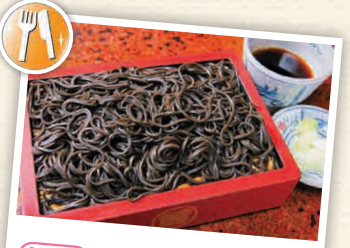
H3-6 ร้านโตะโระริยะ สาขาหลัก

ร้านเก่าแก่ที่ขาย "ฮิดะมิ" ซึ่งคืออาหารที่อร่อยด้วยซอสโชยุ เหล้ามิรินและน้ำตาล รวมทั้งวัตถุดิบจำพวก ปลา ทอย กุ้ง ☎ 460 ชะวะระ-ชิ, คะโตะริ-ชิ ☎ 0120-52-3571 ☎ 8:00-19:00 ☎ ไม่มีวันหยุด ☎ ไม่มี