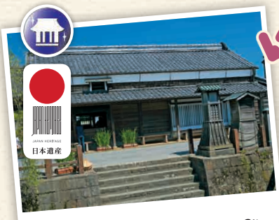
H3-3 บ้านเก่าของอีโน ทะตะทะกะ

พิพิธภัณฑ์อนุสรณ์เพื่ออุทิศความความดีของท่าน "อีโน ทะตะทะกะ" (1745-1818) ผู้ที่สร้างแผนผังที่ปรากฏในปัจจุบันสำหรับการวัดพื้นที่ด้วยการเดินเท้า ☎ 1722-1 ชะวะระ-ชิ, คะโตะริ-ชิ ☎ 0478-54-1118 ☎ 9:00 - 16:30 น. ☎ วันจันทร์ (ในกรณีที่วันวันหยุดนักขัตฤกษ์จะเปิดทำการ) ☎ 500 เยน ☎ ไม่มีวันหยุด