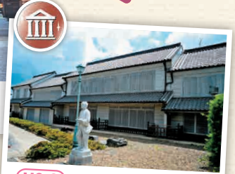
H3-2 พิพิธภัณฑ์อนุสรณ์ อีโน ทะตะทะกะ

ตามการเล่าขานสืบต่อกัน ศาลเจ้านี้ถูกสร้างขึ้นเมื่อ 643 ปี ก่อนคริสตกาล และเป็นศาลเจ้าที่ศักดิ์สิทธิ์ในพิธีกรรม และมีประวัติศาสตร์โดดเด่นไปทั่วประเทศ ปัจจุบัน ตัวอาคารศาลเจ้าจะทาสีด้วยสีดา ซึ่งต้องแลกเงินพิเศษเฉพาะ: ☎ 1697 (คะโตะริ, คะโตะริ-ชิ) ☎ 0478-57-3211 ☎ 8:30 - 17:00 น. ☎ ไม่มีวันหยุด ☎ ไม่มีค่าเข้าชม