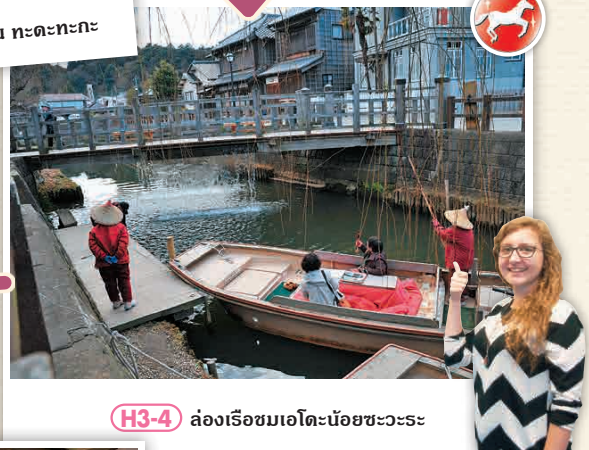
H3-4 ล่องเรือชมเอโดะน้อยชะวะระ

บ้านที่อีโน ทะตะทะกะใช้ชีวิตอยู่นาน 30 ปี ตัวบ้านยังคงหลงเหลือมาตั้งแต่สมัยเอโดะ ได้รับเลือกให้เป็นร่องรอยทางประวัติศาสตร์ของญี่ปุ่น ☎ 1900-1 ชะวะระ-ชิ, คะโตะริ-ชิ ☎ 0478-54-1118 ☎ 9:00 - 16:30 น. ☎ ไม่มีวันหยุด ☎ ไม่มีค่าเข้าชม