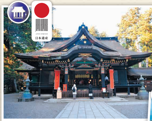
H3-1 ศาลเจ้าคะโตะริจิงกู

จากสถานี Sawara ไปยังศาลเจ้าคะโตะริจิงกู จะห่างประมาณ 5 กม. จึงแนะนำให้ใช้บริการรถแท็กซี่ วันเสาร์-อาทิตย์และวันหยุดนักขัตฤกษ์ มีบริการรถเข็น Sawara จากสถานีไฟราคา 300 เยน หรือตัวหนา 1 วัน 500 เยน ซึ่งใน 1 ชั่วโมงจะมีบริการเดินรถ 1-2 เที่ยว สามารถเที่ยวชม Sawara ด้วยรถเดินเล่นได้