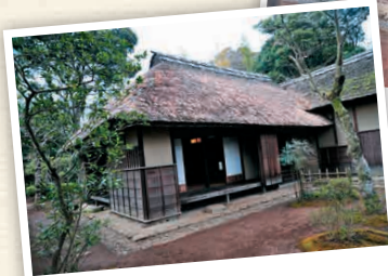
H4-1 ดุกุทาสันนักรบ

บ้านพักชาวยุโรปในช่วงปลายสมัยเอโดะนี้ได้รับการฟื้นฟูขึ้นมาใหม่และเปิด แอสู่อาคารชน 3 หลัง สามารถเรียนรู้วิถีชีวิตของชาวยุโรปในยุคนั้น ๆ ได้