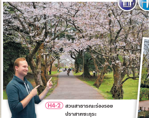
H4-2 สวนสาธารณะร่องรอยปราสาทชะกุระ