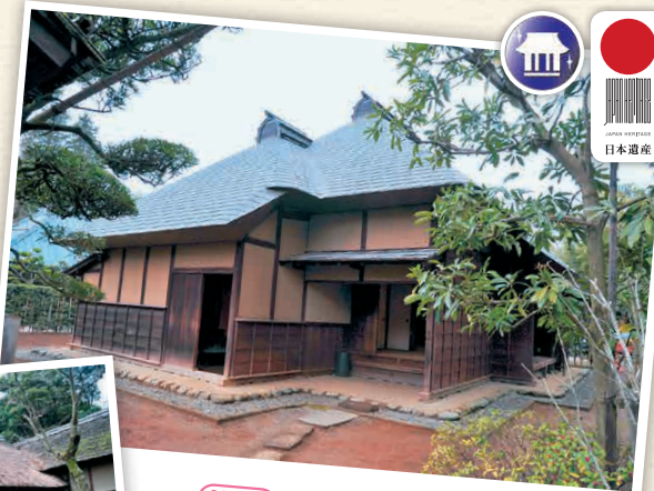
H4-1 ดุกุทาสันนักรบ

ที่มีร่องรอยปราสาทชะกุระนั้นจะมีจุดน่าสนใจทางประวัติศาสตร์ที่ได้รับการขึ้นทะเบียนเป็นมรดกญี่ปุ่น จึงอยากจะไปเที่ยวชมที่ทั่วถึงด้วย จุดน่าสนใจต่าง ๆ จะอยู่กระจัดกระจายกัน จึงแนะนำให้เช่ารถขับ ดูนโยบายการจองรถที่อยู่ที่อยู่บริเวณประตูทางทิศใต้ของสถานี JR Sakura จะมีบริการให้เช่าจักรยาน (9:00 - 16:00 น. 1 คัน 500 เยน)