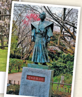
H4-2 สวนสาธารณะร่องรอยปราสาทชะกุระ

📍 ตั้งอยู่บงชิ, โจโน-โตะ, ชะกุระ-ชิ 043-484-6165 🗓️ เข้าชมฟรี 🕒 ไม่มีวันหยุด 🚗 ไม่มีค่าใช้จ่าย