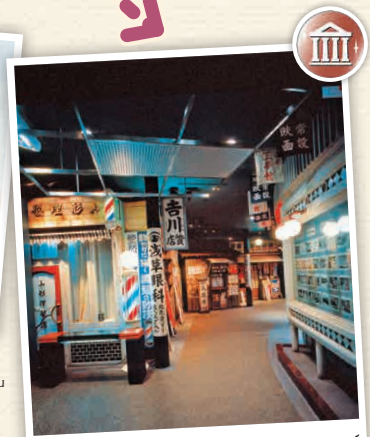
H4-3 พิพิธภัณฑ์สถานแห่งชาติประวัติศาสตร์ชนบธรรมเนียมญี่ปุ่นบ้าน

📍 117 โจโน-โตะ, ชะกุระ-ชิ 03-5777-8600 🕒 9:30 - 17:00 น. (เดือนตุลาคมถึงเดือน กุมภาพันธ์ เปิดถึง 16:30 น.) 🗓️ วันจันทร์ 💰 420 เยน 📄 มี