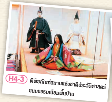
H4-3 พิพิธภัณฑ์สถานแห่งชาติประวัติศาสตร์ชนบธรรมเนียมญี่ปุ่นบ้าน

เป็นจุดที่นักท่องเที่ยวสามารถเรียนรู้ประวัติศาสตร์ญี่ปุ่นที่แบ่งออกเป็น 6 สมัยได้อย่างครอบคลุมด้วยเอกสารชิ้นเยี่ยมและภาพสามมิติ