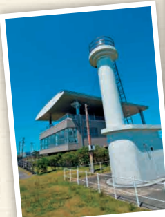
H5-2 หอชมวิวกุสุมะอิโกะชิโอะคะ