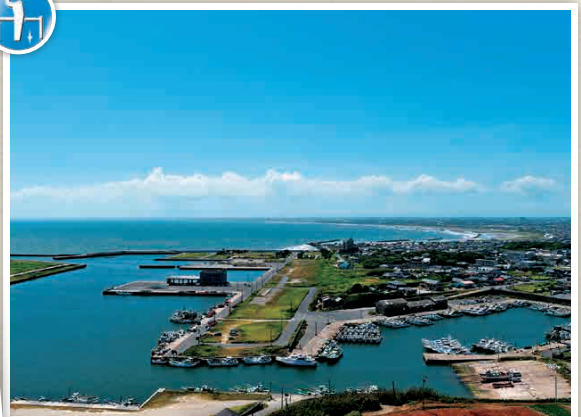
H5-2 หอชมวิวกุสุมะอิโกะชิโอะคะ ~แสงและลม~

จุดชมวิวกุสุมะอิโกะชิโอะคะ 60 เมตรที่หันหน้าเข้าหาสมุทรแปซิฟิก สามารถชมวิวกะแสนอกเห็นพระอาทิตย์ตกลงสู่ทะเลได้