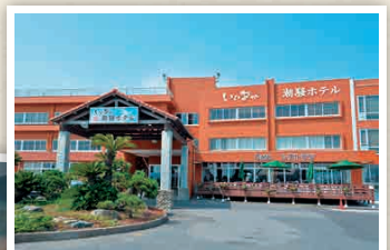
H5-3 โรงแรมอิโกะชิโอะคะ

มีน้ำพุร้อนธรรมชาติสีน้ำตาลเข้มข้นที่ขึ้นชื่อเรื่องสรรพคุณทางการแพทย์ต่าง ๆ นอกจากนี้ยังมีชายหาดที่สวยงามมองเห็นอยู่ใกล้ ๆ ด้วย