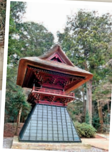
H5-1 วัดฮังโดจิ