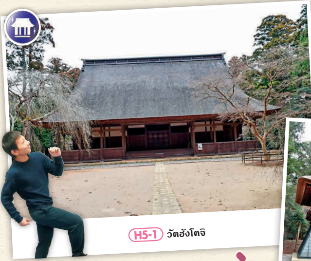
H5-1 วัดฮังโดจิ

การไปวัดฮังโดจินั้น ควรสำรองที่ที่เดินสบายเพราะต้องเดินขึ้นบันไดจากป้ายรถบัส กรณีที่เดินทางไกลรถแท็กซี่ จะคุ้มค่ากว่าหากใช้บริการตั้งแต่ 3 คนขึ้นไป แนะนำให้ไปชำระล้างร่างกายและหิ้วของตัวการขึ้นรถแท็กซี่ในตอนท้ายสุด