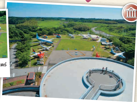
H8-2 พิพิธภัณฑ์วิทยาศาสตร์การบิน

🕒 11:11-3 อิวะฮิเมะ, ชิยะฮิเมะ-มะชิ, ซันบุ-กุน ☎ 0479-78-0557 🕒 10:00 - 17:00 น. (เวลาเข้ารอบสุดท้าย 16:30 น.) 📄 วันจันทร์ (ในกรณีที่ เป็นวันหยุดนักขัตฤกษ์จะหยุดในวันถัดไป, เดือนสิงหาคมไม่มีวันหยุด) 📄 500 เยน 📺 มี