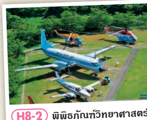
H8-2 พิพิธภัณฑ์วิทยาศาสตร์การบิน

☎ 1338-1 โตเกียว-โทโย, นาริตะ-ชิ 0476-33-3309 🕒 6:00 - 23:00 น. (อาคารซากุระ โยะระโนะเอะชิ 9:00 - 18:00 น.) 📄 ไม่มีวันหยุด 📺 มี