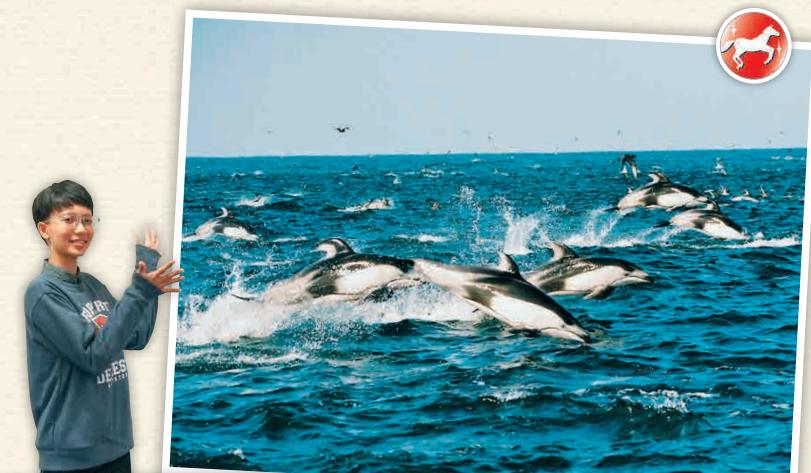
H9-1 จุดชมโลมา ศูนย์วิจัยชายฝั่งเมือง Choshi

ในการชมโลมาบริเวณนอกชายฝั่งนี้จะมีใช้เวลา 3 - 4 ชั่วโมง แต่เนื่องจากการชมปลาวาฬจะมีช่วงเวลา 4 - 5 ชั่วโมง หากไม่มีเวลาเพียงพอ แนะนำให้ชมโลมาบริเวณนอกชายฝั่งแทน (ใช้เวลา 1 ชั่วโมง 30 นาที) โดยเฉพาะเดือนมิถุนายนถึงเดือนตุลาคมเท่านั้น นอกจากนี้ยังมีกิจกรรมส่องเรือชมพระอาทิตย์ตกอีกด้วย