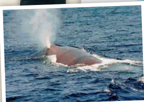
H9-1 จุดชมโลมา ศูนย์วิจัยชายฝั่งเมือง Choshi

🕒 15-9 มิถุนายน-ธ.ค., โยชิ-ชิ 0479-24-8870 🕒 8:00 - 19:00 น. 📄 ไม่มีวันหยุดประจำ ¥ 3,500 เยนขึ้นไป 📺 มี