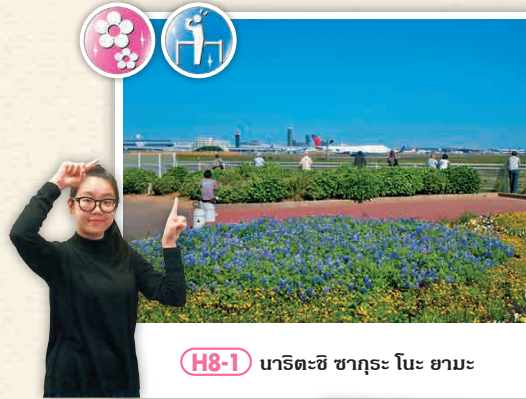
H8-1 นาริตะชิ ซากุระ โนะ ยามะ

การไปพิพิธภัณฑ์วิทยาศาสตร์การบินโดยขึ้นรถบัส JR Highways จากท่าอากาศยานที่ 3 ประตูทิศตะวันออกของสถานี Tokyo นอกจากนี้ยังมีรถสายที่ไปพิพิธภัณฑ์วิทยาศาสตร์การบินโดยเฉพาะแล้ว ยังให้บริการรถสายที่ไปท่าอากาศยานนานาชาติ หรือสายที่ไปเทศบาลเมือง Soga ได้ด้วย ใช้เวลาประมาณ 1 ชั่วโมง 30 นาที 1,680 เยน นอกจากนี้ รถบัสสาย Naniwa ทางฝั่งเมืองโตเกียวที่ป้าย Naritashi Sakura No Yama จึงควรตรวจสอบให้ถี่ถ้วน และเนื่องจากรถบัสคันนี้ที่ป้าย Naritashi Sakura No Yama นี้ยังมีจำนวนไม่มากนัก จึงควรตรวจสอบเวลาล่วงหน้า