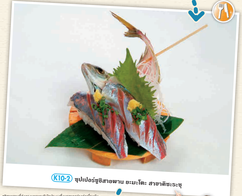
K10-2 ซูเปอร์ชูชิสายพาน ยะมะโตะ สาขาติชะระชู

ชูชิสายพานที่ส่งตรงมาจากบริษัทประมงซึ่งผูกขาดอย่างตึงมือกับเขตประมงและมีปลาที่สดใหม่จากธรรมชาติ อีกทั้งหน้าของซูชิก็มีมากกว่า 100 ชนิด