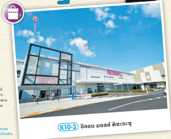
K10-3 อีออน มอลล์ ติชะระชู

ซูเปอร์มาร์เก็ตขนาดใหญ่และมอลล์ที่เป็นแหล่งรวมร้านขายสินค้าเฉพาะกว่า 160 ร้าน รองรับไปต่ออาหาร สันทนาการ อากิเซ็น โรงภาพยนตร์ และสนามรถโกคาร์ท เป็นต้น