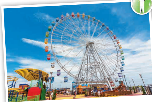
ชิงช้าสวรรค์ Kisarazu

มาเที่ยวเล่นที่แหล่งท่องเที่ยว 2 แห่งที่ตั้งอยู่ติดกับ Mitsui Outlet Park Kisarazu กันเถอะ