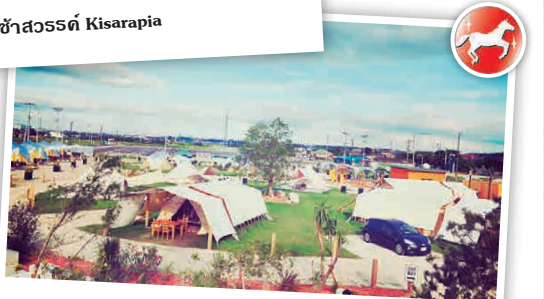
WILD BEACH SEASIDE GLAMPING PARK

สามารถเพลิดเพลินกับการเครื่องเล่นได้ถึงครบครันกับชิงช้าสวรรค์ที่สูง 60 เมตร ซึ่งสามารถชมวิวอ่าวได้เที่ยว และ Aqua Line ได้อย่างทั่วถึง