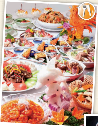
K3-2 โรงแรมเซินเนริ

☎ 940-3 ทบรุระ, ฟุตสึ-ชิ ☎ 0439-37-3211 🕒 9:30 - 16:30 น. (เว้นเสาร์-อาทิตย์และวันหยุดนักขัตฤกษ์ 9:00 - 17:00 น. แยกต่างกันไปขึ้นอยู่กับช่วงเวลา) 📅 ไม่มีวันหยุด (เดือนธันวาคม-เดือนมกราคม ไม่มีวันหยุดประจำ) 🍷 ได้กรวยส้มขึ้นไป 1,500 เยน 📄 มี