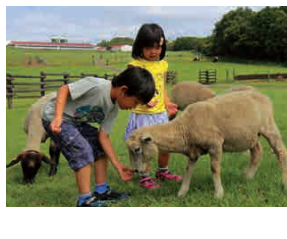
K3-1 มาเฮอร์ฟาร์ม

เป็นฟาร์มท่องเที่ยวที่มีสิ่งน่าสนใจมากมาย เช่น สามารถสัมผัสสัตว์ได้ และมีการแสดงโชว์ของแกะหรือไถ่ลูกแกะน่ารัก ฯลฯ