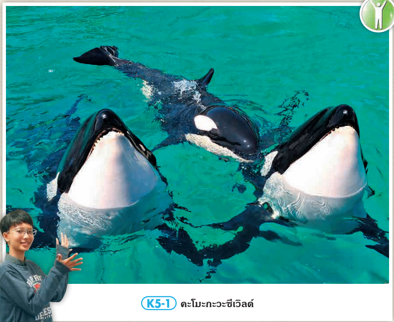
K5-1 ทะมะกะวะชิเวิลด์

การไป Awa-Kamogawa นั้น กำเดินทางมาจาก Tokyo / Kaitumakuhari จะสะดวกกว่า แต่หากมาจาก สถานี Chiba จะเดินทางได้ค่อนข้างยาก ซึ่งการเดินทางไปนั้นมีความวุ่นวายขึ้นอยู่กับเวลาที่ออกเดินทาง จึงควรตรวจสอบก่อนล่วงหน้า มีจุดนำส่งที่หลายแห่งอยู่รอบบริเวณ Awa-Kamogawa สามารถเดินเล่นและช้อปปิ้งที่วอร์ม 1 บริเวณได้