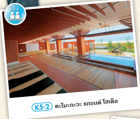
K5-2 ทะมะกะวะ แกรนด์ โฮเต็ล

มีห้องพักผ่อนขนาดใหญ่ที่มองเห็นวิวทะเลและยังสามารถชมวิถีทะเลปิ้งไฟได้จากห้องพักรับประทานอาหารค่ำที่วิวสวย