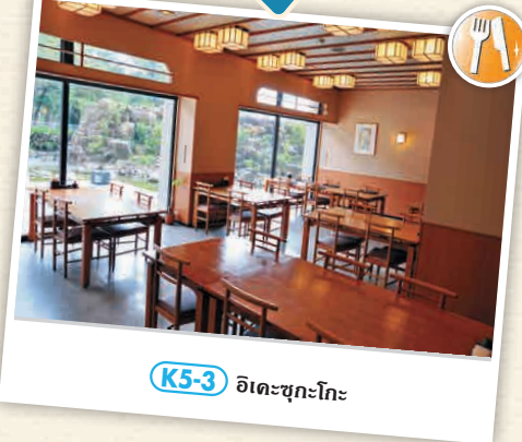
K5-3 อิเคะซุกะโกะ

☎ 820 ชิโระบะ, ทะมะกะวะชิ ☎ 04-7092-2111 🕒 11:00 - 22:00 น. (เวลาเช็คอินสุดท้าย 21:00 น. มีบริการนำรถเข็นขึ้นลงที่สถานี) 📄 ไม่มีวันหยุดประจำ ☎ 1,620 เยน