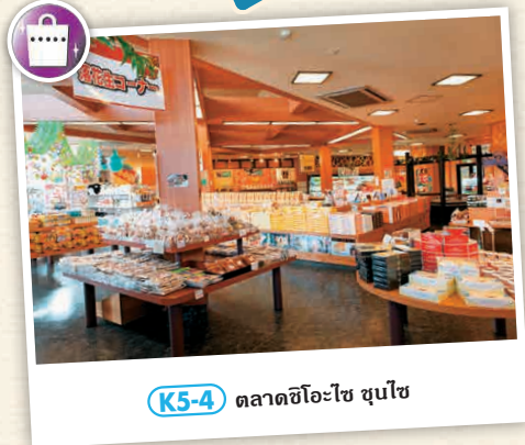
K5-4 ตลาดชิโอะไซ ชุนโซ

☎ 834 ทะมะกะวะแกรนด์ทาวน์เวอร์, ชิโระบะ, ทะมะกะวะชิ ☎ 04-7093-6111 🕒 7:30-9:00 น., 11:30-14:00 น., 17:30-20:00 น. 📄 ไม่มีวันหยุด ☎