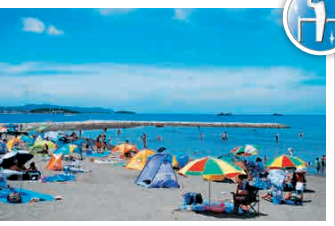
ชายฝั่งโฮโจ

เกาะเล็ก ๆ ที่อยู่ห่างออกไปประมาณ 1 กิโลเมตร รอบอ่าวทะทะฮะมะะ-ชิ ภายในเกาะมีน้ำลึกที่ลึกชวนให้รู้สึกปลอดภัยอย่างอื่น สามารถเที่ยวชมรอบ ๆ ได้โดยใช้เวลาประมาณ 30 นาที ☎ ฟุจิมีฟุจิน, ทะทะฮะมะะ-ชิ ☎ 0470-22-2544 🕒 เข้าชมฟรีโดยอิสระ 📅 ไม่มีวันหยุด