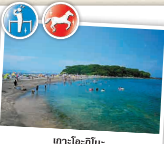
เกาะโอะกิโนะ

ชายฝั่งส่วนใหญ่ของคาบสมุทรโบโซ ในช่วงหน้าร้อนจะเต็มไปด้วยผู้คนที่มาเล่นน้ำทะเลและเล่นกีฬาทางน้ำ ☎ ชิซึกิ 2307-18 โยชิ, ทะทะฮะมะะ-ชิ ☎ 0470-22-2544 🕒 เปิดภาคตั้งแต่กลางเดือนกรกฎาคมไปจนถึงปลายเดือนสิงหาคม