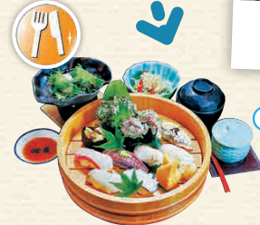
K8-3 ร้านอาหาร โซฮงเต็น

นับเป็นเวลาว่างสบายใจที่ควรชมแล้วที่ร้านยังมีบริการปรุงอาหารพื้นบ้านอร่อยมาโดยตลอดติดกับคาบสมุทรโบโซได้ ชมทะเลหน้าอาหารประเภทปลาสดใหม่ ☎ 2619-6 โยชิ, ทะทะฮะมะะ-ชิ ☎ 0470-22-1385 🕒 11:00 - 14:00 น., 16:00 - 21:30 น. (วันเสาร์-อาทิตย์ และวันหยุดนักขัตฤกษ์ปิดทำการตลอดวัน) 📅 วันจันทร์ที่ 3 ของเดือน (ในกรณีที่ในวันหยุดนักขัตฤกษ์จะเปิดบริการ) PP