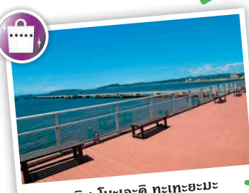
นะกะชิโนะเอะจิ ทะทะฮะมะะ-ชิ

สถานที่จัดจำหน่ายสินค้า เช่น ฝัก, ของทะเลสดใหม่ ในท้องถิ่นและของกระจุกกระจิก เป็นต้น พร้อมมีพื้นที่จัดแสดงสิ่งมีชีวิตในทะเลจากอ่าวทะทะฮะมะะ-ชิ ☎ 1564-1 ทะทะฮะมะะ-ชิ ☎ 0470-22-3606 🕒 9:00 - 18:00 น. (เปิดบริการตั้งแต่เวลา 16:45 น.) 📅 ไม่มีวันหยุด