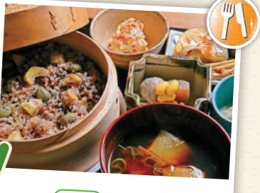
NI-6 ร้านคุระโซ

อาคารคลังเอกสารที่สามารถศึกษาค้นคว้าเป็นอยู่ในสมัยเอโดะได้ทางห้องจัดแสดงที่รับชมฟรีจากใต้ถุน ชั้นที่ 1 เป็นร้านค้า ส่วนชั้นที่ 2 เป็นที่ทำงานของช่างฝีมือ ☎ 153-1 อุชิโบ, โตะเกกิ-มะชิ, อิชิซุมิ-กุน ☎ 0470-80-1146 ☑ 9:00 - 17:00 น. (พ.ศ. - ก.พ. เปิดถึง 16:00 น.) ☑ ไม่มีวันหยุด ☑ ไม่มีค่าเข้าชม