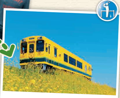
NI-2 รถไฟอูชิโบมิ เทะสึโด

ทิวทัศน์คลองสองฟากฝั่งของทางรถไฟอันสดใสและทุ่งรถไฟโตสโงยุคินี่เป็นขบวนรถไฟสายท้องถิ่นที่สวยงามเหมือนภาพวาดอย่างยิ่ง เป็นสถานที่ที่มีปรากฏอยู่ทางโทรทัศน์และภาพยนตร์อยู่บ่อยครั้งด้วย ☎ 0436-23-5584 ☑ สำหรับสมาชิกรถไฟ Goi - Yoroikekoku ในวันเสาร์-อาทิตย์ และวันหยุดนักขัตฤกษ์จะมี 11 รอบไป-กลับ (3 รอบในขณะเป็น Torokoku Train) ซึ่งมีขบวนไป-กลับถึงสถานีรถไฟ Yoroikekoku รวมอยู่ด้วย 5 รอบ ☑ จองล่วงหน้าการให้บริการ (ค่าโดยสารแยกต่างหาก) 500 เยน สำหรับขบวนรถไฟ 1 วัน 1,800 เยน ☑