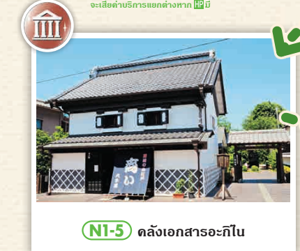
NI-5 คลังเอกสารอะกิโน

เป็นบ้านเรือนราษฎรที่ถูกสร้างในปี 1849 และเป็นสมบัติทางวัฒนธรรมที่สำคัญของชาติ คุณอะนะนะะที่เป็นเจ้าของบ้านเป็นพ่อค้าที่ทำธุรกิจการค้าในละแวกนั้น ☎ 126 อุชิโบ, โตะเกกิ-มะชิ, อิชิซุมิ-กุน ☎ 0470-80-1146 ☑ เข้าชมฟรี (ค่าเข้าชม 1,000 เยน) ☑ ไม่มีวันหยุด ☑ ไม่มีค่าเข้าชม