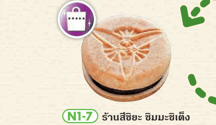
NI-7 ร้านสึชิยะ ซิมมะชิเต็ง

เป็นร้านอาหารที่ทำการปรุงโดยเชฟปรุงรสและวัตถุดิบที่ผลิตในพื้นที่ ใช้ส่วนผสมรสชาติและการแต่งจานประณีตตามวัฒนธรรมชาติโดยมีเชฟฝึกหัดที่ผ่านการฝึกด้วย ☎ 32 ชะกุระ-โตะ, โตะเกกิ-มะชิ, อิชิซุมิ-กุน ☎ 0470-82-4949 ☑ 11:30 - 14:30 น., 15:30 น. - (สองตารางคืนเป็นระยะเวลาของล่วงหน้า) ☑ วันจันทร์, วันอังคาร และวันจันทร์-อังคารของช่วงเดือนมกราคม - มีนาคม ☑