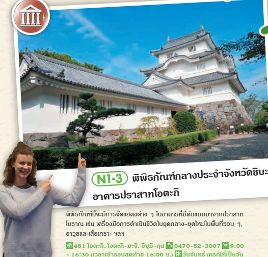
NI-3 พิพิธภัณฑ์กลางประจำจังหวัดชิบะ อาคารปราสาทโตะเกกิ

เป็นรถไฟสายท้องถิ่นที่เปิดทำการเดินทางเดียว มีชื่อเสียงโด่งดังในด้านรถไฟเชิงกิจกรรม อาทิเช่น ขบวนรถไฟที่สามารถเพลิดเพลินกับอาหารแบบคันตงได้ ฯลฯ ☎ 0470-82-2161 ☑ มีรอบเดินรถไฟไป-กลับ 15 รอบในวันธรรมดา ใน 1 ชั่วโมง จะมีบริการ 1 เที่ยว ☑ จองล่วงหน้าขบวนรถไฟ 1 วัน 1,000 เยน ☑