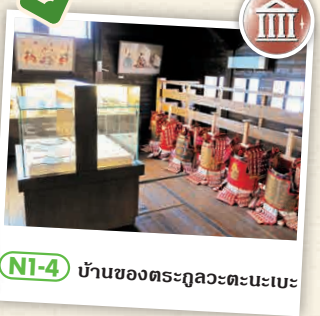
NI-4 บ้านของตระกูลอะนะนะะ

พิพิธภัณฑ์ที่มีการจัดแสดงต่าง ๆ ในอาคารที่มีต้นแบบมาจากปราสาทโบราณ เช่น เครื่องมือการดำเนินชีวิตในยุคกลาง-ยุคใหม่ในพื้นที่รอบ ๆ, อาวุธและสื่อกระดาษ ฯลฯ ☎ 481 โตะเกกิ, โตะเกกิ-มะชิ, อิชิซุมิ-กุน ☎ 0470-82-3007 ☑ 9:00 - 16:30 (เวลาเข้าชมสุดท้าย 16:00 น.) ☑ วันจันทร์ (กรณีที่เป็นวันหยุดนักขัตฤกษ์จะหยุดในวันถัดไป) ☑ 200 เยน, สำหรับงานจัดแสดงจะเสียค่าบริการแยกต่างหาก ☑