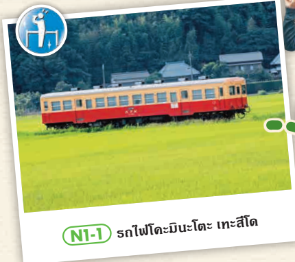
NI-1 รถไฟโคะมิเนตะ เทะสึโด