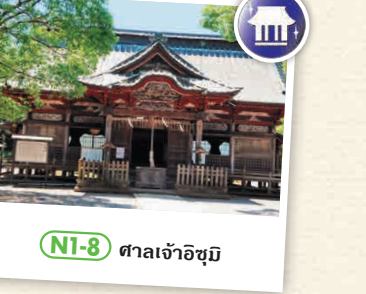
NI-8 ศาลเจ้าอิชิซุมิ

ร้านนี้เป็นที่รู้จักเนื่องจาก "ซิมมะชิซึชิจินจิน Goba" ที่เป็นขนมชื่อดังในท้องถิ่น เป็นขนมที่ทำด้วยแป้งสาลีที่มีรสเค็มเป็นส่วนใหญ่และกับดกวน ☎ 83 ซิมมะชิ, โตะเกกิ-มะชิ, อิชิซุมิ-กุน ☎ 0470-82-5656 ☑ 9:00 - 17:30 ☑ วันพุธ