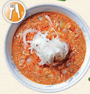
N3-3 ร้านโอโฮะคุจิโดโกโร อิชิจิ

เป็นศาลเจ้าญี่ปุ่นที่เป็นที่รู้จักกันจาก "เทศกาล Big Hina Matsuri" ซึ่งต้องงบทศกาลที่จัดแสดงโชว์ "ฮิเมะมิงกียว (ตุ๊กตาเจ้าหญิงฮิเมะ)" หรือตุ๊กตาที่ใช้ยอธฐานของพรโด้เด็กหญิงมีความสูงมากกว่า 1,800 ตัว ☎ ฮิเมะคะสึอูระ, คะสึอูระ-ชิ ☎ 0470-73-6641 🕒 9:00 - 17:00 น. 🚗 ไม่มีวันหยุด 🚗 ไม่มีค่าใช้จ่าย