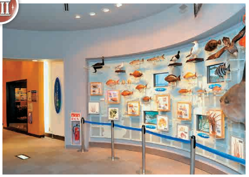
N3-5 พิพิธภัณฑ์ทางทะเล พิพิธภัณฑ์กลางประจำจังหวัดชิบะ

พิพิธภัณฑ์ที่สามารถเรียนรู้เกี่ยวกับนิเวศน์ทางทะเลของบริเวณไปโซได้ มีการจัดงานใหญ่แบบที่จะได้สัมผัสประสบการณ์จากการใช้สิ่งแวดล้อมทางธรรมชาติโดยรอบให้เกิดประโยชน์ ☎ 123 โอโฮะคุ, คะสึอูระ-ชิ ☎ 0470-76-1133 🕒 9:00 - 16:30 น. (เวลาเข้าชมสุดท้าย 16:00 น.) 🚗 วันจันทร์ (ในกรณีที่ในวันหยุดนักขัตฤกษ์จะหยุดในวันถัดไป) 🕒 200 เยน 🚗 ปี