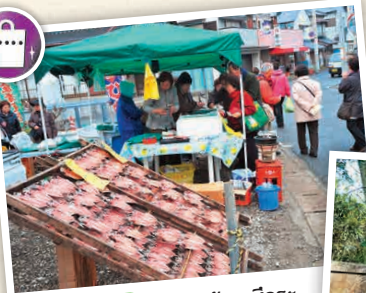
N3-1 ตลาดเช้าคะสึอูระ (Katsura Morning Market)

ตลาดนัดริมถนนที่เปิดทุกวัน ยกเว้นวันพุธ มีประวัติศาสตร์มากกว่า 400 ปี เน้นขายสินค้าที่เป็นวัตถุดิบสำหรับทำอาหาร ผู้คนตลาดเช้ารอบปราสาทในเมืองคะสึอูระ (วันที่ 1-15 ของทุกเดือน) กับตลาดเช้ากะอะมะชิ-อิชิริ (วันที่ 16 - สิ้นเดือนของทุก ๆ เดือน) ☎ 0470-73-1658 🕒 6:00 - 11:00 น. 🚗 วันพุธ