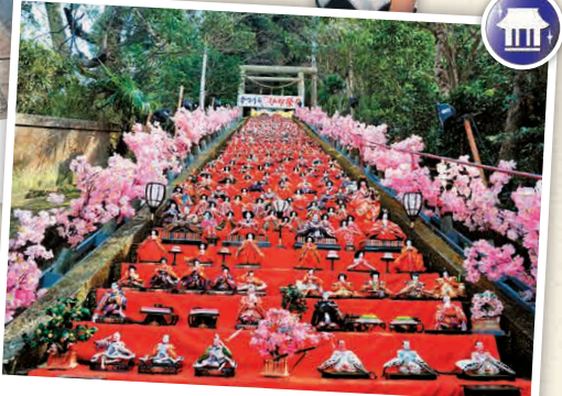
N3-2 ศาลเจ้าโทมะชิเกอิ

เป็นศาลเจ้าญี่ปุ่นที่เป็นที่รู้จักกันจาก "เทศกาล Big Hina Matsuri" ซึ่งต้องงบทศกาลที่จัดแสดงโชว์ "ฮิเมะมิงกียว (ตุ๊กตาเจ้าหญิงฮิเมะ)" หรือตุ๊กตาที่ใช้ยอธฐานของพรโด้เด็กหญิงมีความสูงมากกว่า 1,800 ตัว ☎ ฮิเมะคะสึอูระ, คะสึอูระ-ชิ ☎ 0470-73-6641 🕒 9:00 - 17:00 น. 🚗 ไม่มีวันหยุด 🚗 ไม่มีค่าใช้จ่าย