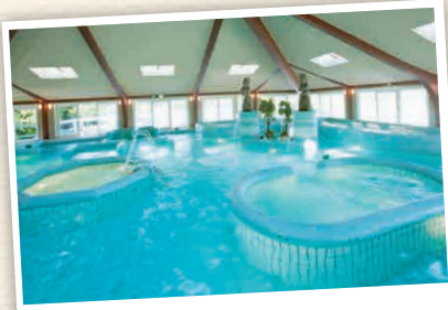
N4-1 Thermes Marins Du Pacifique

สปาที่มีโปรแกรมหลากหลายของ "Thalasso Therapy" นั้นมีการใช้น้ำจากมหาสมุทรแปซิฟิก ทั้งยังมีแพ็คเกจที่สามารถใช้บริการที่พักรวมในและนอกโรงแรมได้ด้วย ☎ 1920 โคะเคอิ, ตะลิสสะ-ชิ ☎ 0120-655-779 🕒 9:00-21:00 น. (Aquatonic ถึง 20:30 น.) 📍 ไม่มีวันหยุดประจำ 💰 Aquatonic 4,320 เยน (ตั้งแต่ 17:30 น. เป็นต้นไป ราคา 2,160 เยน ค่าบริการวันธรรมดา) - ฟรี