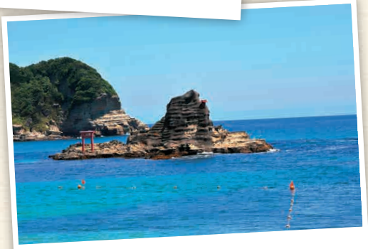
N4-2 ลานเล่นน้ำทะเลโมะริยะ ไคซุชิ โยะคุโตะ

ได้รับการเลือกให้เป็น "1 ใน 100 ลานเล่นน้ำทะเลยอดนิยม" ที่น้ำทะเลมีระดับความใสสูง ประตุศาลเจ้าชินโตสีแดงที่ตั้งอยู่ในทะเลนั้นทำให้เกิดวิวที่ต้นแบบประเทศญี่ปุ่นอย่างแท้จริง ☎ โมะริยะ, ตะลิสสะ-ชิ ☎ 0470-73-6641 📍 ปกติทะเลสีแดงกลางเดือนกรกฎาคมถึงปลายเดือนสิงหาคม