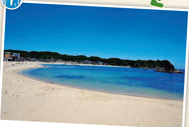
N4-2 ลานเล่นน้ำทะเลโมะริยะ ไคซุชิ โยะคุโตะ

ได้รับการเลือกให้เป็น "1 ใน 100 ลานเล่นน้ำทะเลยอดนิยม" ที่น้ำทะเลมีระดับความใสสูง ประตุศาลเจ้าชินโตสีแดงที่ตั้งอยู่ในทะเลนั้นทำให้เกิดวิวที่ต้นแบบประเทศญี่ปุ่นอย่างแท้จริง ☎ โมะริยะ, ตะลิสสะ-ชิ ☎ 0470-73-6641 📍 ปกติทะเลสีแดงกลางเดือนกรกฎาคมถึงปลายเดือนสิงหาคม