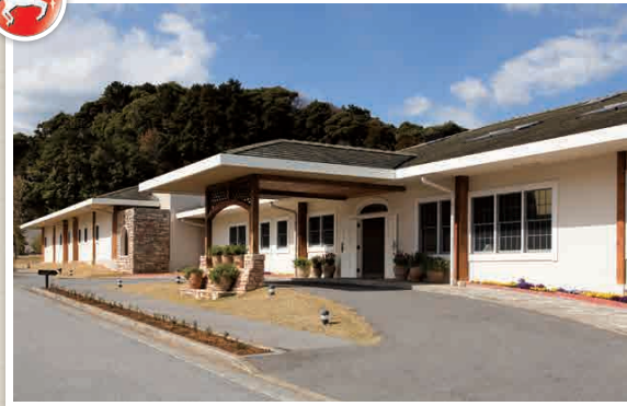
N4-1 Thermes Marins Du Pacifique

สปาที่มีโปรแกรมหลากหลายของ "Thalasso Therapy" นั้นมีการใช้น้ำจากมหาสมุทรแปซิฟิก ทั้งยังมีแพ็คเกจที่สามารถใช้บริการที่พักรวมในและนอกโรงแรมได้ด้วย ☎ 1920 โคะเคอิ, ตะลิสสะ-ชิ ☎ 0120-655-779 🕒 9:00-21:00 น. (Aquatonic ถึง 20:30 น.) 📍 ไม่มีวันหยุดประจำ 💰 Aquatonic 4,320 เยน (ตั้งแต่ 17:30 น. เป็นต้นไป ราคา 2,160 เยน ค่าบริการวันธรรมดา) - ฟรี