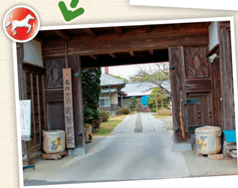
N5-2 โรงกลั่นเหล้าดังกิกิ

สามารถเก็บสตรอว์เบอร์รีอันสดกลีบหนาดิบในไร้อสตรอว์เบอร์รีที่มีมากกว่า 20 แปลงของเมืองชิมามุ ฤดูกาลเก็บเกี่ยวคือช่วงตั้งแต่กลางเดือนธันวาคมถึงช่วงกลางเดือนพฤษภาคม ที่หน้าสถานี JR ปรุโจ (ศูนย์บริการข้อมูลท่องเที่ยวหน้าสถานี, 305 สีเบะ, ชิมุ-ชิ 0475-82-2071) ระยะเวลา 40 นาที ในช่วง 10:00 - 15:00 น. ตั้งแต่กลางเดือนธันวาคมถึงกลางเดือนพฤษภาคม (จะปิดไร้อที่เมื่อสตรอว์เบอร์รีสุกจนหมดไป) 15 ไม่มีวันหยุดประจำ 1,100 - 2,000 เยน (แตกต่างกันขึ้นอยู่กับช่วงเวลา) 15 มี