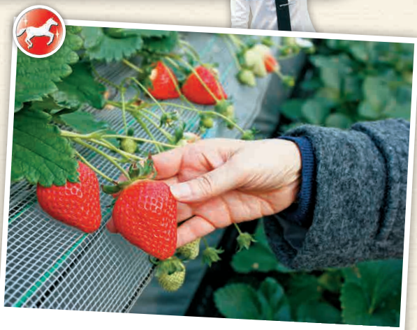
N5-1 เก็บสตรอว์เบอร์รี

สำหรับการเก็บสตรอว์เบอร์รีนั้น คุณจะได้รับคำแนะนำว่าไร้อสตรอว์เบอร์รีที่แนะนำในวันนั้น ๆ ใต้ศูนย์บริการข้อมูลการท่องเที่ยวหน้าสถานี และเนื่องจากเส้นทางส่วนใหญ่จะเดินทางด้วยรถแท็กซี่ จึงขอแนะนำให้ไปด้วยรถ 3-4 คน รถแท็กซี่ญี่ปุ่นนั้นจะสามารถเรียกกลางทางได้ แต่ไม่สามารถขอให้เจ้าหน้าที่ของสถานที่ต่าง ๆ ช่วยเรียกให้ได้เช่นกัน