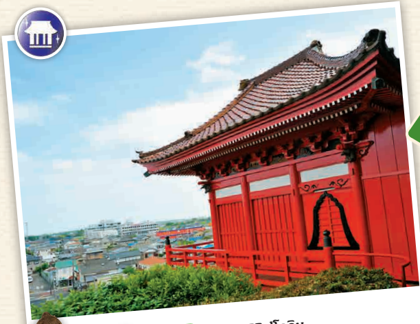
N5-4 วัดนะมิดิริฟูโดอิน

วิหารหลักสีแดงที่ตั้งอยู่ตอนกลางของภูเขาแห่งนี้ก็คือ วัดที่ให้ผู้มีศรัทธาตั้งใจอย่างจริง เป็นแหล่งรวบรวมความศรัทธาอันแรงกล้าจากผู้ที่ขออภัยกับการประมุขซึ่งจะอธิษฐานไปตลอดทั้งปี ที่ 2551 ปรุโจ, ชิมุ-ชิ 0475-82-2176 สามารถเดินชมได้ข้างอริสะโบะฮอนเทคพระอาราม 15 ไม่มีวันหยุด 15 ไม่มีค่าเข้าชม 15 มี