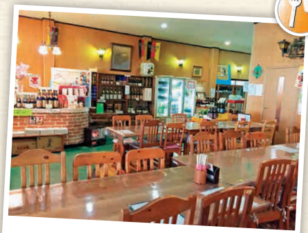
N5-3 Beer Restaurant ในโรงกลั่นเหล้าดังกิกิ

เป็นโรงกลั่นเหล้าที่ไม่ได้ผลิตเฉพาะเหล้าญี่ปุ่นเท่านั้นแต่ยังผลิตเบียร์พื้นเมืองอีกด้วย สามารถเข้าชมคลังเหล้าได้ และตั้งแต่เดือนพฤศจิกายนถึงเดือนมีนาคมจะสามารถเข้าชมงานได้อีกด้วย ที่ 11 ทะตะโนะซัง-โคะ, มะสึโอะ-มะชิ, ชิมุ-ชิ 0479-86-3050 10:00 - 16:00 น. 15 ไม่มีวันหยุด 15 ไม่มีค่าเข้าชม 15 มี