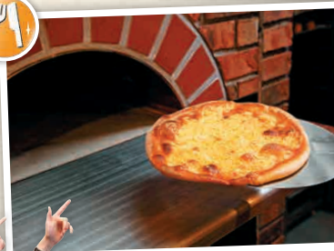
N8-2 เซมโนะโมะริ กัตตาการ Boulogne