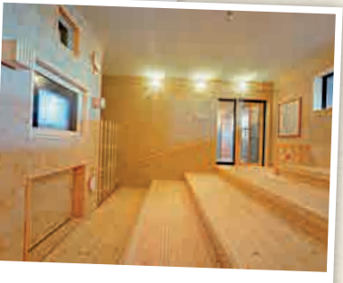
TI-2 แหล่งต้นน้ำของน้ำพุร้อนนะนะโคโด้