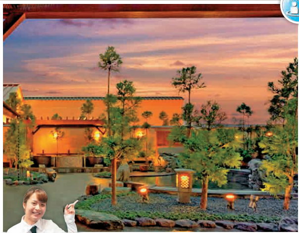
TI-2 แหล่งต้นน้ำของน้ำพุร้อนนะนะโคโด้

อาคารเขื่อนน้ำที่มีน้ำอุ่นหลากหลายสไตล์และสามารถนั่งดูวิวทิวทัศน์ได้ เช่น ชาวมาลมาโพร ฯลฯ นอกจากนี้ยังสามารถรับประทานอาหารได้ด้วย