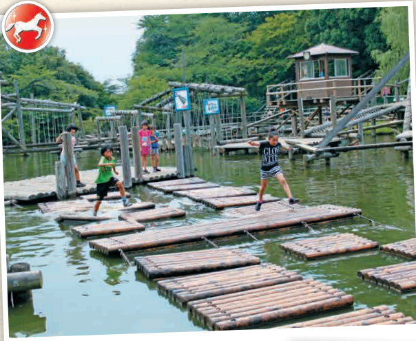
TI-1 สวนสาธารณะชิมิซึ

มาลองทำน้ำไปสนุกกับที่สนามกีฬาที่นะนะโคโด้ หลังจากสนุกๆไปแล้ว ก็เชิญมาสัมผัสประสบการณ์เขื่อนชิมิซึที่โรงอาบน้ำสาธารณะระดับพรีเมียม สามารถใช้เวลาได้อย่างสบาย ๆ พร้อมรับประทานอาหารใต้ที่จุดพักผ่อน