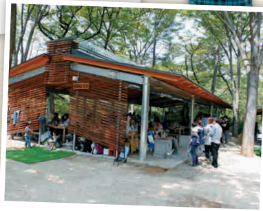
TI-1 สวนสาธารณะชิมิซึ